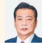
井上 寛 (公明党)