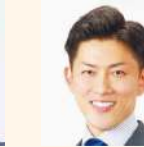
塩生 好紀 (日本維新の会)