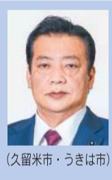
(久留米市・うきは市)

Q 昨年9月の県立学校での自殺事案を受け、①不適切な指導の実態調査、②当該教員への対応、③スクリーニングの推進について教育長に伺う。