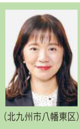
(北九州市八幡東区)

Q 県はどのように新しいアイデアや他県で例のない先駆的取り組みを生み出しているのか伺う。