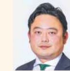
稲又 進一 (公明党)