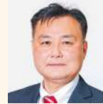
松下 正治 (公明党)