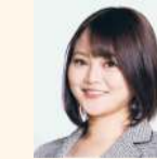
中村 香月 (新国会)